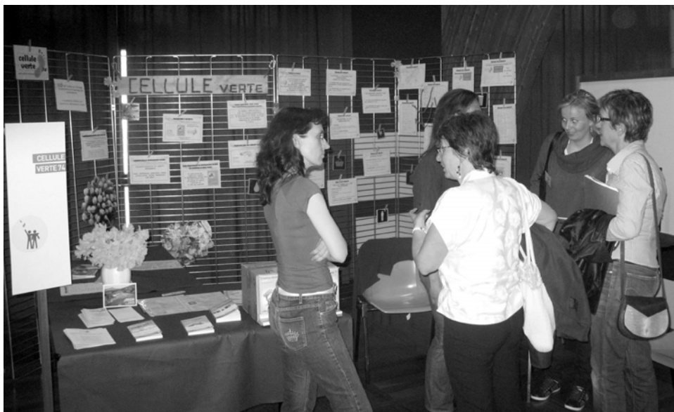
Stand Forum DD Thyez